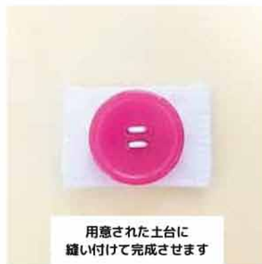
用意された土台に 縫い付けて完成させます