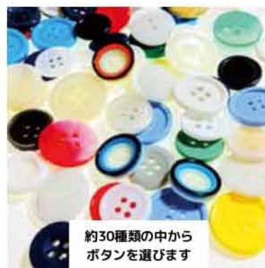
約30種類の中から ボタンを選びます